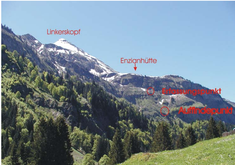
Abb. 2 Übersicht Unfallort

Lawinenwarnzentrale im Bayer. Landesamt für Wasserwirtschaft