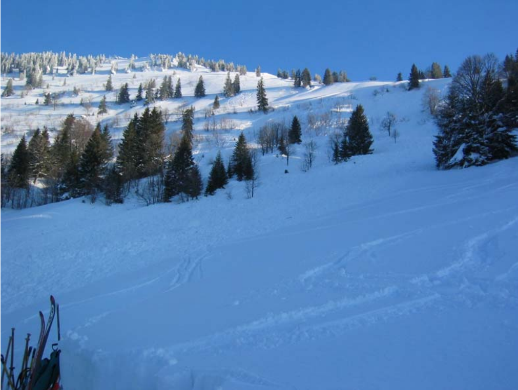
Das Unfallgebiet aus einem anderen Blickwinkel

Der Unfall ereignete sich gegen 14:00 Uhr. Die Alarmierung der Bergwacht Oberstaufen erfolgte um 14:30 Uhr. Bereits 10 Minuten später wurde der erste Lawinhund auf der Lawine abgesetzt. Die Suche in dem schwer zugänglichen Gelände mit weiteren Lawinhunden und mit Sondiermannschaften erstreckte sich bis kurz nach 16:00 Uhr, bis der Verschüttete in 1½ Meter Tiefe gefunden werden konnte.