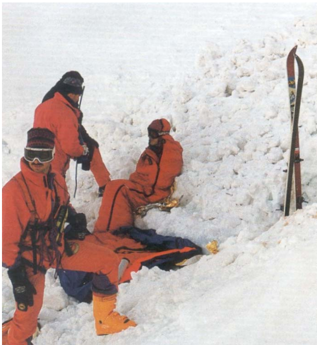
Abb. 1 Lawinenunfall am 4. Januar 1997: Bergwachtmänner und der Verunglückte bei seiner Bergung am 8. Januar 1997

Das Ehepaar S. (28 bzw. 30) aus dem Landkreis Ravensburg unternahm am 04. Januar 1997 eine Skitour in den Allgäuer Alpen, für die mehrere Tage vorgesehen waren. Die Tour begann etwa um 13.00 Uhr in Lechleiten (Tirol). Während dieser Zeit lagen bei vorherrschendem Hochdruckeinfluß die Temperaturen sowohl am Tage wie in der Nacht deutlich unter Null Grad. Wegen des späten Aufbruchs konnte das Ziel der ersten Etappe, die südlich von Einödsbach gelegene Rappenseehütte (2091 m ü. NN), erst in der Dunkelheit er-