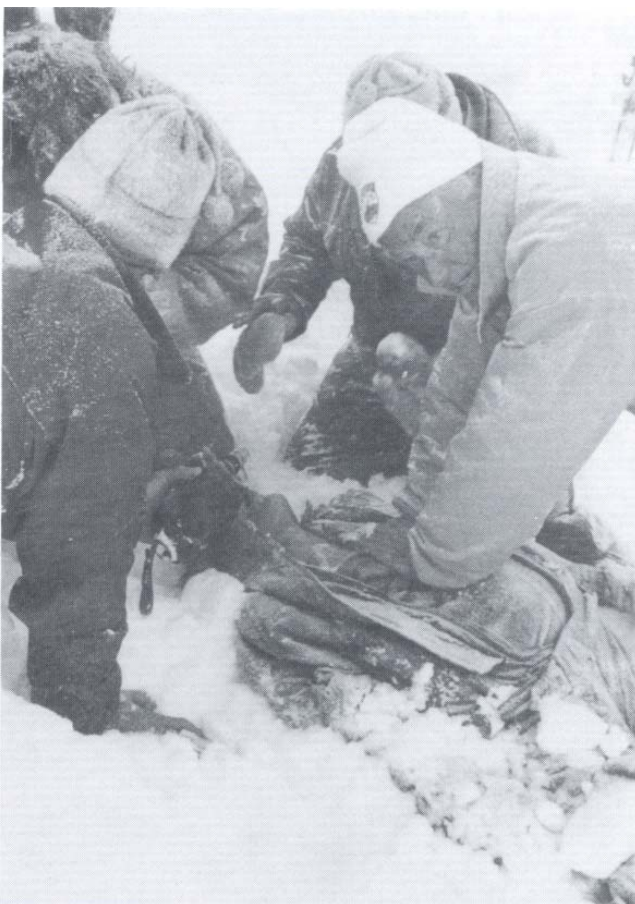
Abb. 1 Ärztliche Hilfe kam zu spät

Bei einer Kontrollfahrt zur Erkundung der Lawinensituation im Skigebiet Osterfelder wurde gegen 13.00 Uhr festgestellt, dass unterhalb der Schöngänge und unmittelbar südlich der Skiabfahrt eine Skispur in das